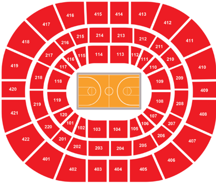
Ülker Spor ve Etkinlik Salonu Oturma Planı / Seating Plan