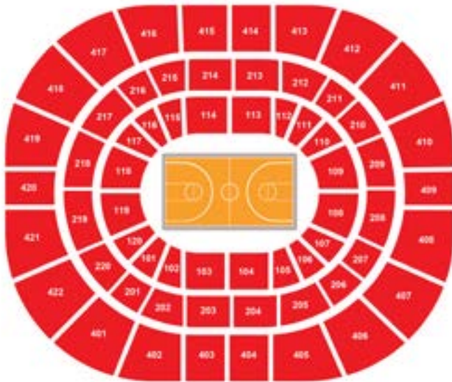
Ülker Spor ve Etkinlik Salonu Oturma Planı / Seating Plan